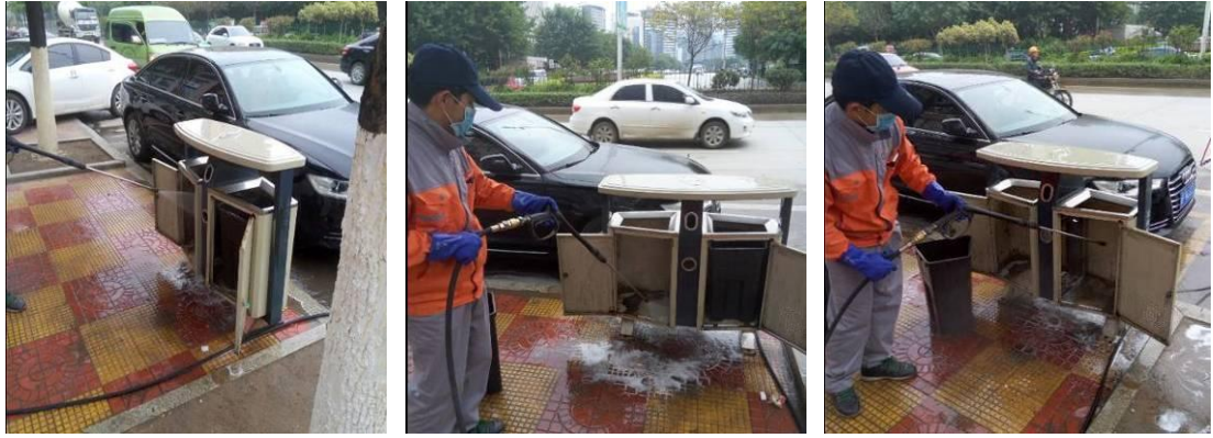
4、对内桶进行全面冲洗