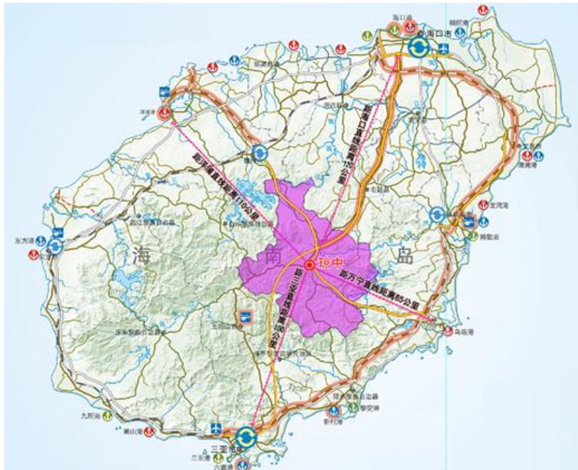
图 1-1 琼中县区位图

琼中黎族苗族自治县是海南省下辖的民族自治县之一，县境地处海南岛中部，五指山北麓，县政府驻营根镇。全境面积 2704.66 平方公里，辖营根镇、湾岭镇、黎母山镇、红毛镇、长征镇、中平镇、和平镇、什运乡、上安乡、吊罗山乡等 10 个乡镇，两个县属林场和一个县属农场，境内还有阳江、乌石、加钗、长征 4 个国营农场，总人口 17.96 万。是海南岛公路南北、东西走向的交通枢纽。