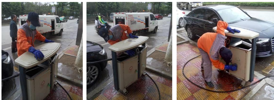
6、钢丝球和清洁剂清洗后，用高压水枪对果皮箱和地面进行冲洗